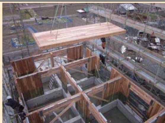
CLTで建設中の共同住宅(岡山県真庭市)